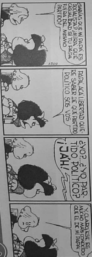
Maldita por Quino

Los grupos de ultraizquierda y ultraderecha son los que se proponen llegar a los objetivos trazados sin tener en cuenta la ley, empleando en muchos casos la violencia o el terrorismo; es decir, se ubican fuera del sistema democrático.