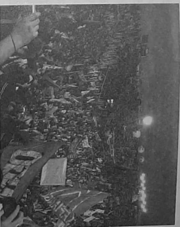
Participación política en un acto en el club Huracán 11-3-2011