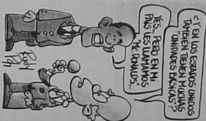
Ruoy, Paul. Extraído de Sáizra/12

Los partidos surgen como grupos extraparlamentarios recién a fines del siglo XIX (excepto en Estados Unidos, donde se formaron antes de 1850), cuando se quieren captar los votos populares que existen gracias a la ampliación del sufragio. En Inglaterra, pese a que la división parlamentaria entre tories (conservadores) y whigs existía desde el siglo XVII, no tuvieron programas ni organización permanente hasta la creación, en 1861, de una sociedad liberal, y en 1870 de otra conservadora. Los partidos políticos franceses surgieron en la II República, en 1848, pero con el Segundo Imperio napoleónico no se pudieron desarrollar; recién consiguieron estabilidad hacia fines del siglo XIX. En nuestro país surgen con las características del partido moderno, después de 1890.