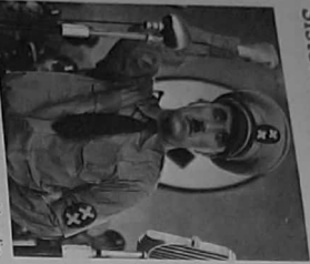
El gran dictador, por Charles Chaplin

En los regímenes democráticos, al ser permanente la participación de los partidos políticos, se conforma un marco jurídico-político y una estructura partidista estable, que se denomina sistema de partidos .