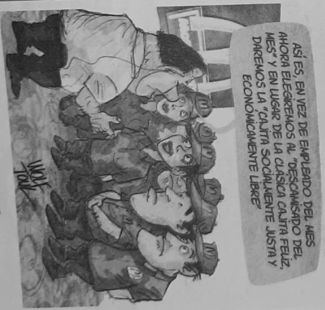
Wolf, Toul.